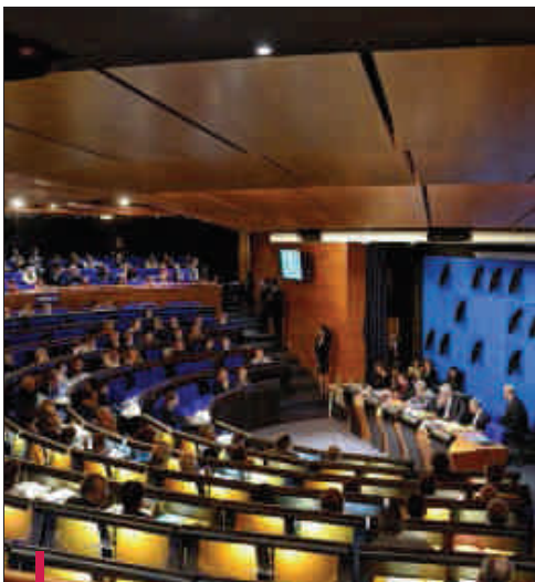
La courte séance plénière à la communauté urbaine MPM n'a pas enflammé les débats.